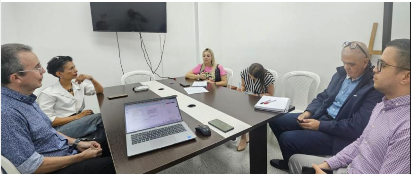
Foto: Cimité 1. Rendición de Cuentas 2026, vigencia 2025.